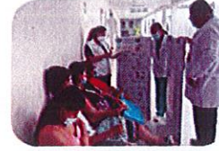
ASOCIACIÓN/ALIANZAS DE USUARIOS

Las jornadas se llevan a cabo en salas de espera y habitaciones de hospitalización, permitiendo una mayor interacción con los usuarios y sus acompañantes. Durante estos espacios se desarrollan actividades educativas, sociales y de orientación, promoviendo una atención más humanizada y participativa.