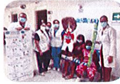
PERSONAL DE LA SALUD