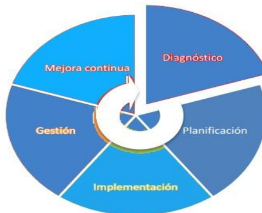
Ilustración 1 – Marco de Seguridad y Privacidad de la Información

Modelo de Seguridad y Privacidad de la Información emitida por MinTIC